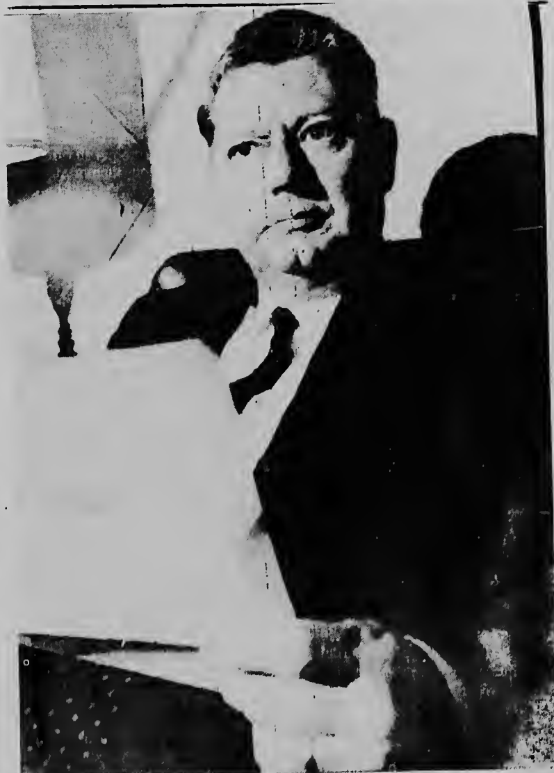
Aki Dr. Nicholas Chetta mirando e nota qu David Ferrie a laga despues qu nan a hafia morto den su apartamento. Jim Garrison no ta di acuerdo cu declaracion di e dokter aki.